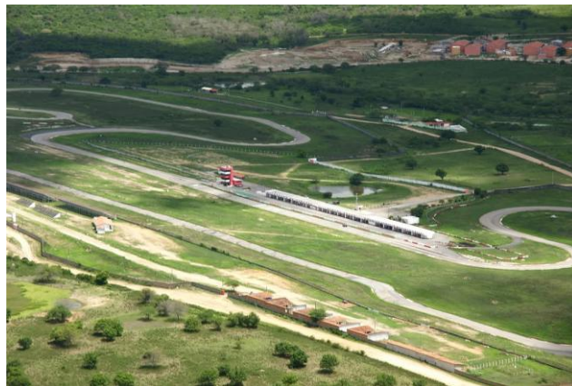
AUTÓDROMO DE CARUARU/PE